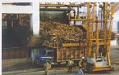
Déchargement des matières premières.