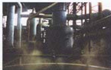
Intérieur de la raffinerie Cuzal.

« Luttons ensemble pour la réforme agraire »