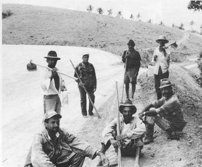
parceiros APRÈS LE TRAVAIL DANS LA ZONE COLLECTIVE DE L' assentamento AMARAGI. Septembre 1999 (BL)

D'autres, qui n'avaient pas accès à un lopin, se réjouissent de pouvoir « travailler pour eux-mêmes », et disent leur espoir dans l'avenir, pour eux et leurs enfants.